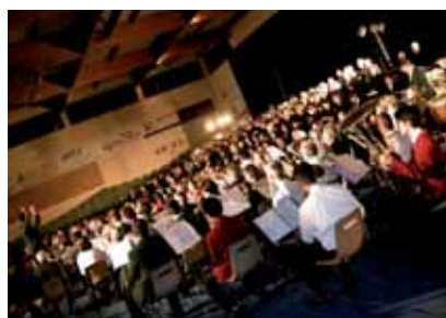
Des prestations de qualité devant un public enthousiaste

Ce sont plus de 1600 spectateurs qui ont assisté le 25 janvier dernier dans la grande salle du complexe sportif Saint-Nicolas de MEURSAULT au grand concert, regroupant environ 300 choristes et instrumentistes, organisé par le Conservatoire BEAUNE, Côte et Sud.