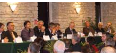
De nombreux élus et représentants socioprofessionnels étaient présents pour assister à la présentation du Contrat d'Agglomération.

Ce Contrat, commun avec le Pays Beaunois, comporte un volet dédié à la Communauté d'Agglomération d'un montant de 4,5 millions d'euros qui permettront de soutenir les grands projets structurants pour le territoire dans des domaines aussi divers que la mobilité, le tourisme, le développement économique, ou encore les services à la personne.